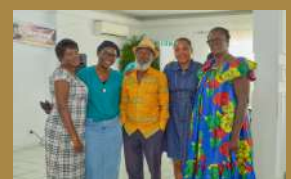
Photos 12 à 15: Quelques membres du DRDS autour des jeunes retraités.