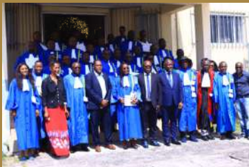
Photo 12: Les récipiendaires autour du Commissaire du CENAREST et des Officiels