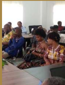
Photos 3 à 5 : Une vue des participants