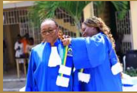
Photo 7: Pose de l'écharpe au Pr. Noëlline Sallah par le Dre. Judith Rachel Renamy Ziza Sougou