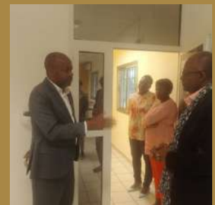
Photos 3 et 4: La délégation de l'IRSH autour du Directeur de l'AUF