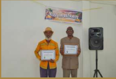
Photos 16 à 17: Nos retraités brandissant leur DIPLOME de nouveaux retraités.